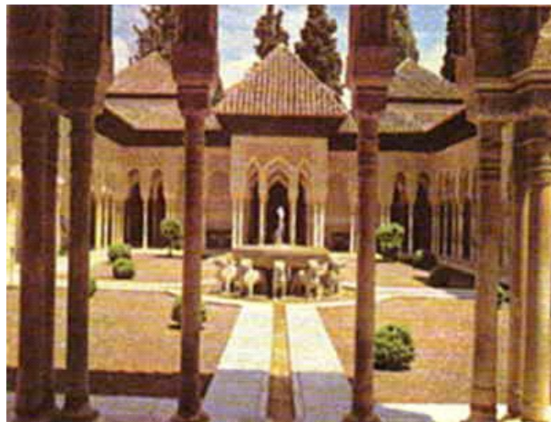
La Alhambra de Granada

La inscripción de alumnos de Brandenburgo sólo es posible si tienen una „Entpflichtungserklärung“ (declaración que le permite al alumno escolarizarse en otra administración regional) de la delegación de educación en cuestión.