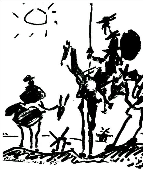
Pablo Picasso: "Don Quijote y Sancho Panza"