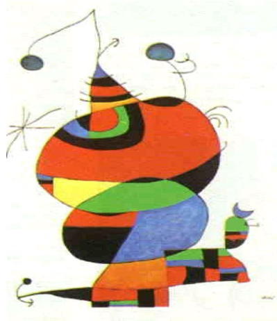
Joan Miró: "Mujer, pájaro y estrella" (Frau, Vogel und Stern)